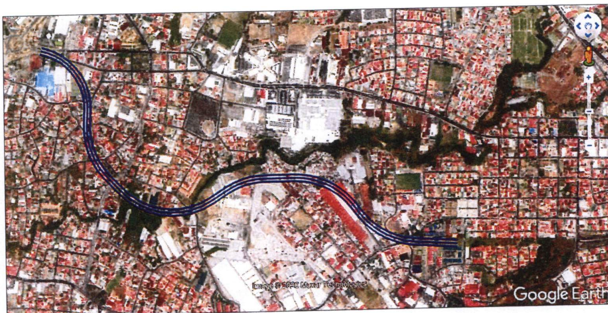
Figura N°1. Trazado preliminar propuesto por la Secretaría Técnica del Consejo Nacional de Concesiones.

En la siguiente figura, se muestra el trazado preliminar propuesto por la Secretaría Técnica del Consejo Nacional de Concesiones (CNC) para el tramo entre Garantías Sociales – Hacienda Vieja, para ser valorado por el Proponente.